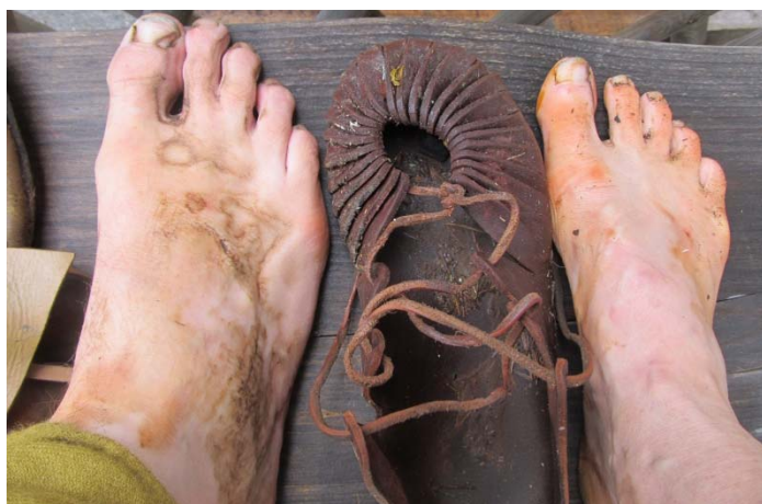
„In die Schuhe eines anderen schlüpfen.“ Hier in die eines Pilgers. Ein Selbstversuch☺